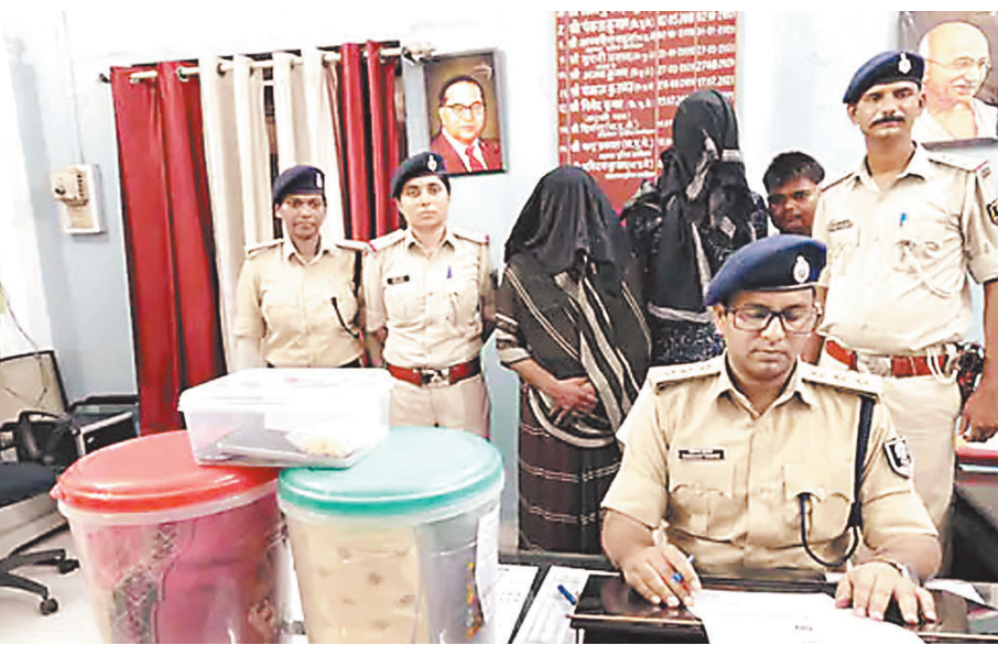
आरा में 11 दिन पहले हुई थी घटना