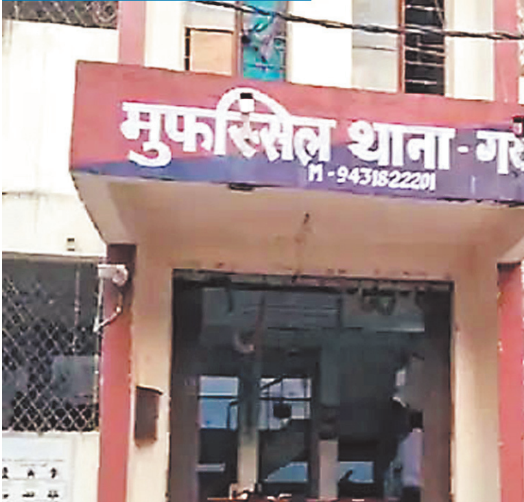
गया में पुलिसकर्मी के साथ मारपीट भी की, पोखर से बाइक हुई बरामद