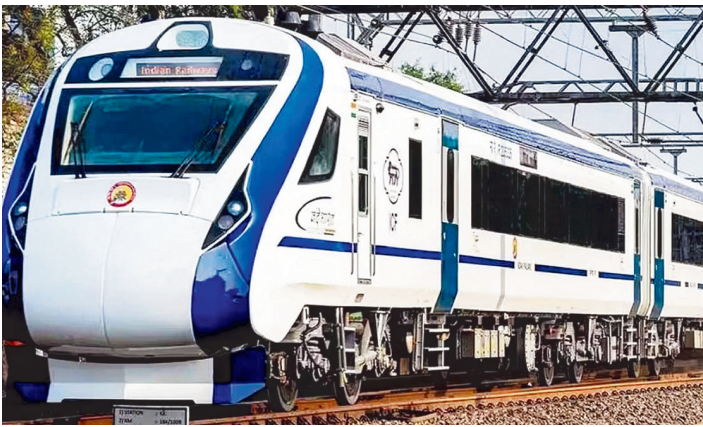
सात घंटे की सफर में यह ट्रेन बनारस से खुलेगी और प्रयागराज, कानपुर सेंट्रल, इटावा, टूंडला होते हुए आगरा पहुंचेगी। 15 सितंबर को इस ट्रेन का शुभारंभ होगा।

रेल अधिकारियों के अनुसार रैक आउटन के लिए पत्र जारी हो चुका है। इस हफ्ते ट्रेन का रूट ट्रायल और स्पीड ट्रायल शुरू हो जाएगा। खास बात कि कवच 2 से लैस इस रैक में यूवी लैंप के साथ ही उच्च दक्षता कनेक्टर का उपयोग हुआ है। कोच के अंदर यात्रियों को आरामदायक सीट और परफ्यूम युक्त वाशरूम मिलेगा।